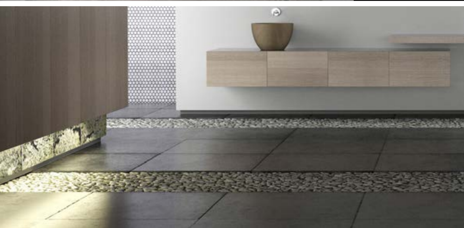
leicht und flexibel