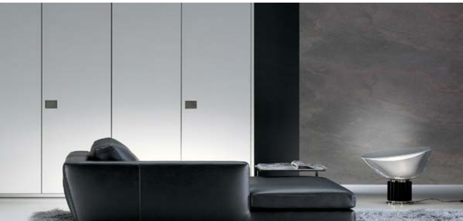
Steinbruch Verde Gris