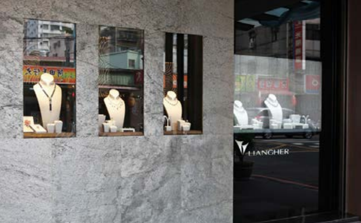
Steinbruch Falling Leaves