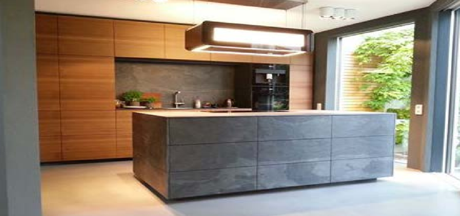
Steinbruch Verde Gris